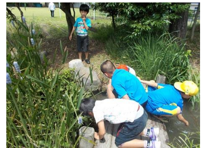
【にじの森での活動の様子】

さて、本年2月1日付けで旭小学校がユネスコスクールに正式に加盟が承認されたという報告が届きました。ユネスコスクールとは、ユネスコ憲章に示されたユネスコの理念を実現するため、平和や国際的な連携をする学校です。文部科学省及び日本ユネスコ国内委員会では、ユネスコスクールをESD（持続可能な開発のための教育）の推進拠点として位置付けています。ユネスコスクールでは、そのグローバルなネットワークを活用し、世界中の学校と交流し、児童生徒間・教師間で情報や体験を分かち合い、地球規模の諸問題に若者が対処できるような新しい教育内容や手法の開発、発展が目指されています。今回加盟承認された学校は、2015年10月に日本ユネスコ国内委員会よりパリにあるユネスコ本部へ申請された40校で、愛知県では、旭小学校のみであります。旭小では、豊かな自然（ビオトープ・芝生広場等）を背景に、命のつながり学習・環境学習・関わり学習など、今後もユネスコスクールの名に恥じぬよう、自然・環境・人とのかわり活動を重視した学習活動を推進していきたいと考えています。