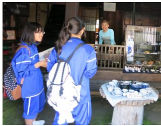
1年校外学習（馬籠妻籠）