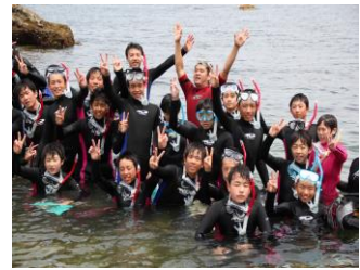
3年修学旅行（ほんまもん体験）