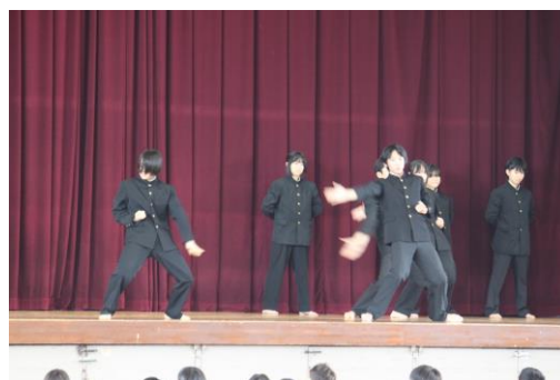
(生徒会による中総体壮行会)

新一年生の皆さんは、新しい舞台を目の前にして期待と不安でいっぱいだと思います。私たちも自分の入学式を思い出すと皆さんと同じ気持ちでした。だからこそ、皆さんに伝えたいことは、何事にもチャレンジ精神で臨んでほしいということです。チャレンジしなければ、何も得ることができません。失敗するかもしれませんが、そこから学ぶことも多いです。それは、これから生きていく中でとても大切なことです。また、旭中はそれができるところです。