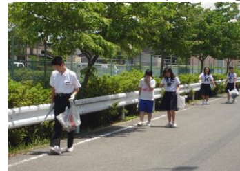
クリーンキャンペーン

絆プロジェクト旭 心の絆の結び合いを尊重しながら、旭中生としての誇りと正しい価値観をもち、適切に判断し行動できる生徒を育てる。