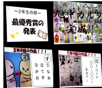
文化発表会「旭中カルタ」