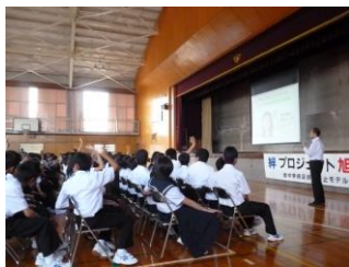
サイバー犯罪防止教室

絆プロジェクト旭 心の絆の結び合いを尊重しながら、旭中生としての誇りと正しい価値観をもち、適切に判断し行動できる生徒を育てる。