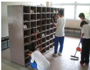
スリッパの裏も拭いてます！