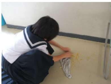
がんこな汚れに挑戦中