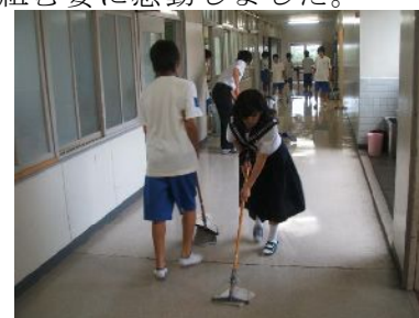
たくさんのボランティア