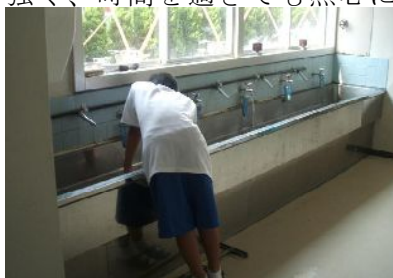
一人で黙々と・・・