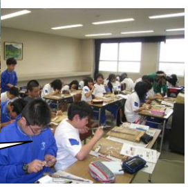
真剣にクラフト制作