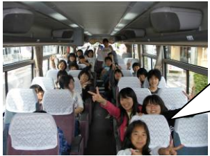
も元気がいいバスの中で