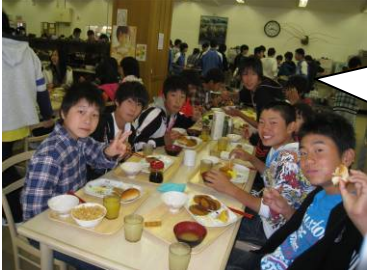
食堂のおいしいバイキング