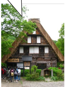
世界遺産白川郷合掌造りを見学。