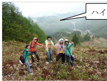
ハイキングも雨の中...