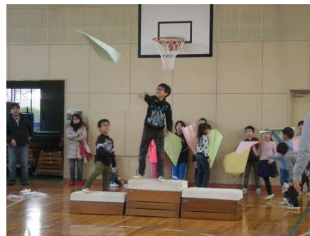
2/17 第2回学校で飛ばそう紙ヒコーキ