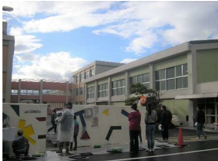
11/19 正門のペンキ塗り