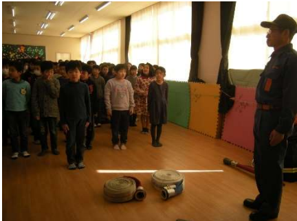
2/16 4年 消防団の方のお話を聞く会