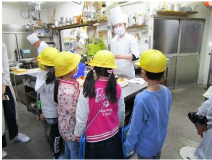
11/7 2年 もっとなかよし町たんけん