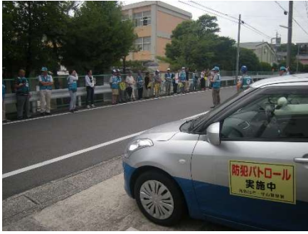
青パト登下校指導