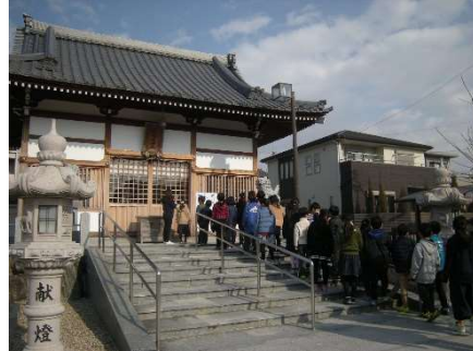
2/15 3年 本地ヶ原神社見学