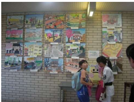
7月「わたしの大切な風景」展覧会