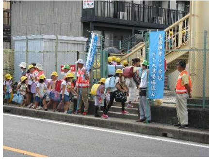
地域のおじさんおばさん運動