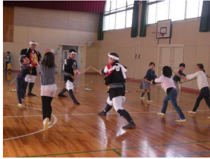
1/16 3年 棒の手体験