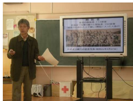
11/19 第3回本地ヶ原のお話を聞く会