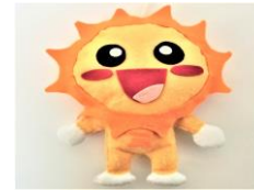
SUNちゃん 〈三郷小キャラクター〉

校訓 みずからすすんでやる子 教育目標 一人一人のよさを認め伸ばすとともに、知・徳・体の調和のとれた人間性豊かで主体的に行動する子どもの育成を図る。