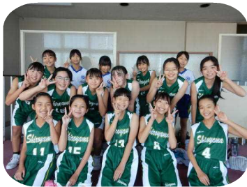
ミニバスケットボール部